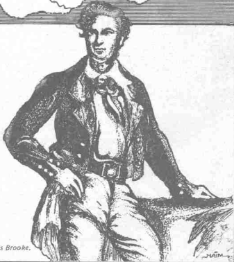
Sir James Brooke.